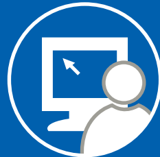
SLS門鎖管理軟體(含金鑰)